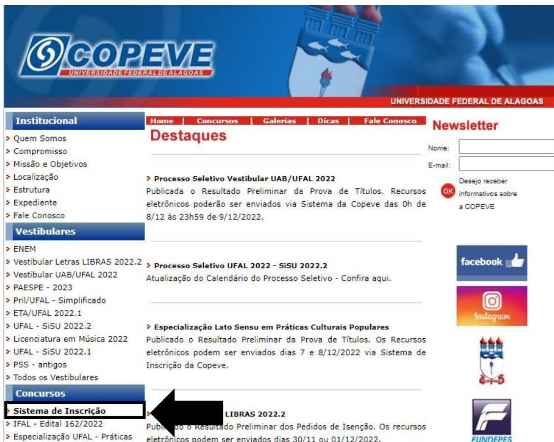
Figura 1 – Acessar Sistema de Inscrição